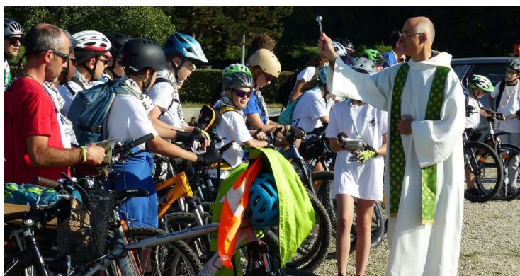
La bénédiction des cyclistes et des VTT avant le départ

Des collégiens venus de toute la région Alsace ont pédalé pour Quelqu'un de plus grand qu'eux . Le 18 août dernier, le Pélè VTT Alsace a démarré sa cinquième édition à Sélestat pour arriver à la basilique mineure de Marienthal, après 200 km à vélo, le vendredi 22 août. Tous ont été accueillis par Monseigneur Pascal Delannoy, très souriant, heureux de voir cette jeunesse priante. Ces adolescents pèlerins étaient soutenus par des étudiants, des prêtres, des séminaristes et une religieuse qui les ont accompagnés, à vélo, dans le vignoble, les villages, les champs de maïs, sous le soleil,