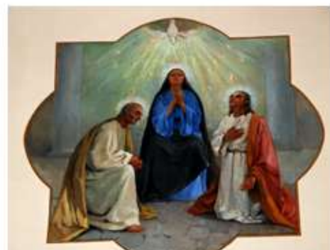
Pentecôte, venue de l'Esprit Saint