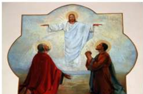
Ascension du Christ